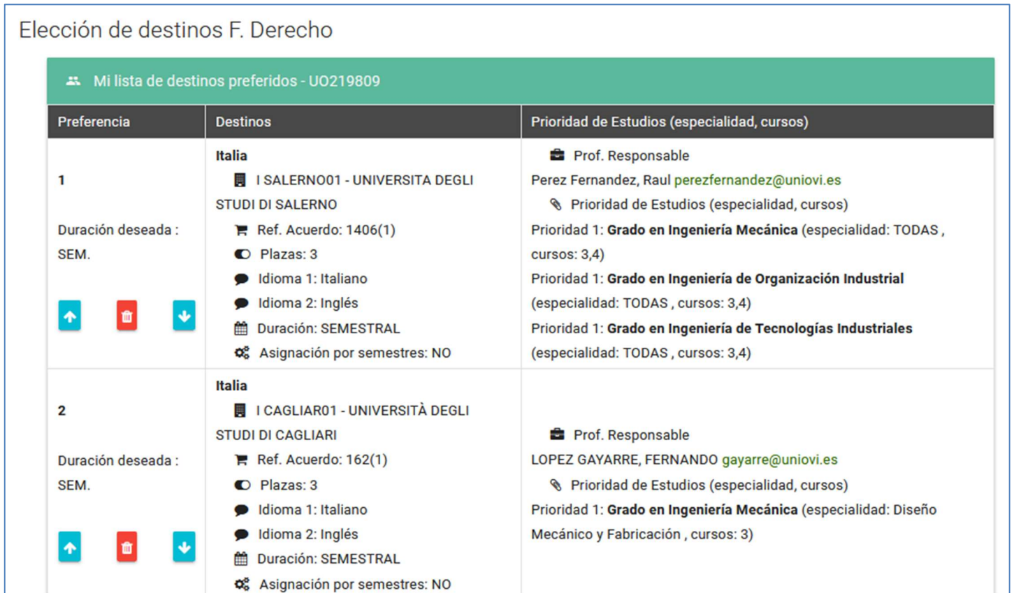
Figura 3. Mi Lista de Destinos Preferidos