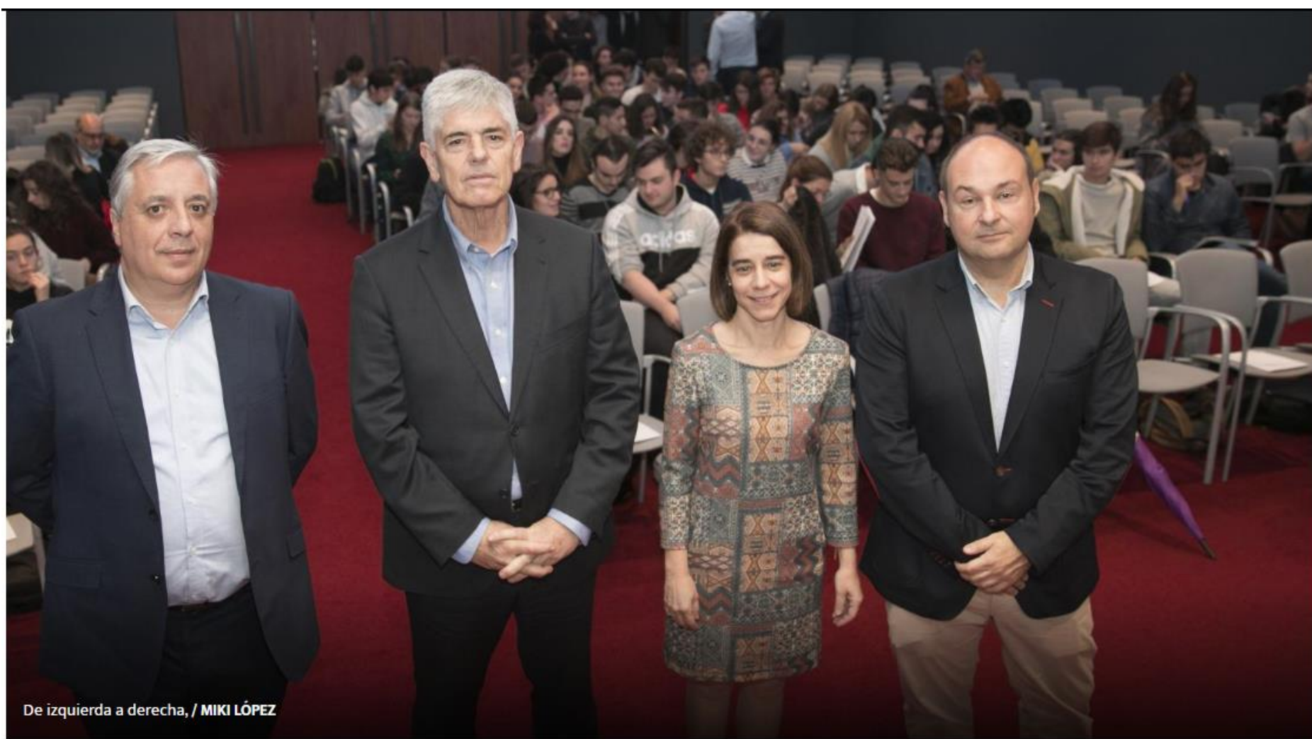
De izquierda a derecha,