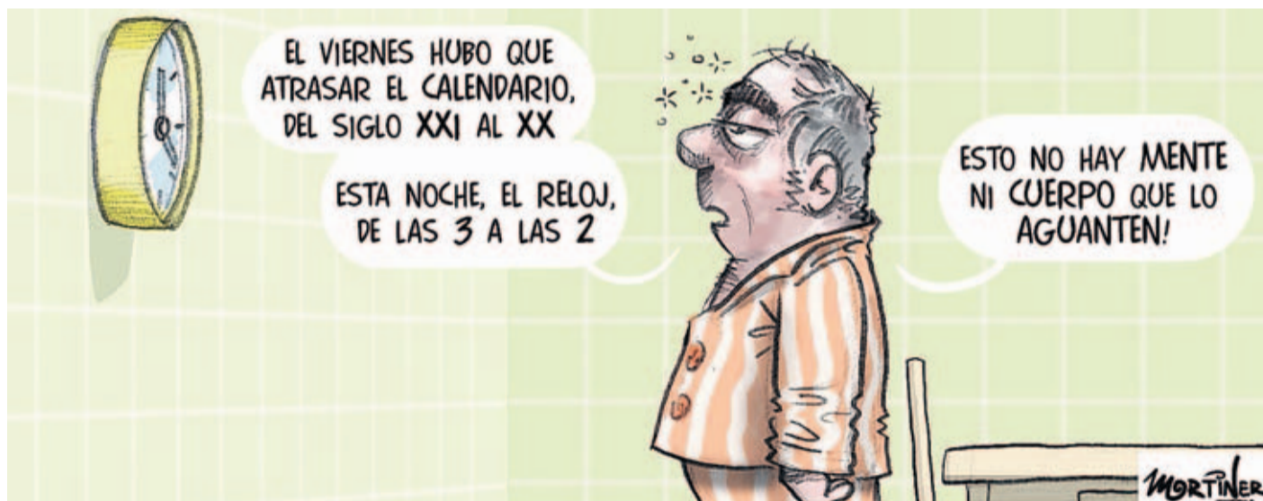
Ilustración: Mortiner Guión: Rogelio Román

En la batahola de la incertidumbre del voto, la España firme y la España blanda, a lo que aspiran los dirigentes de Vox es simplemente a pillar cacho. Si abandonaron el Partido Popular no fue por una concepción de la política distinta y sí porque dentro de él no tenían espacio para medrar. Nadie debería engañarse. No hay en ellos una idea que ahorme el país. Es más creo que no hay en ellos una sola idea digna de ser tenida en cuenta. Como cualquier populismo, la extrema derecha nacional se basa en