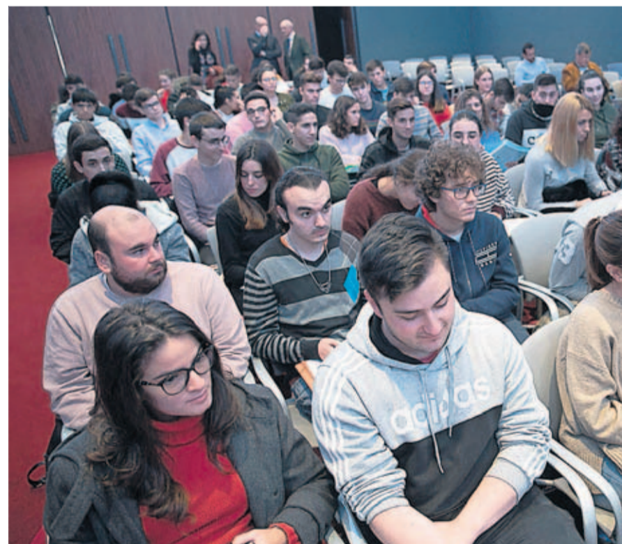
Los estudiantes, durante la jornada de “La Asturias que funciona”.