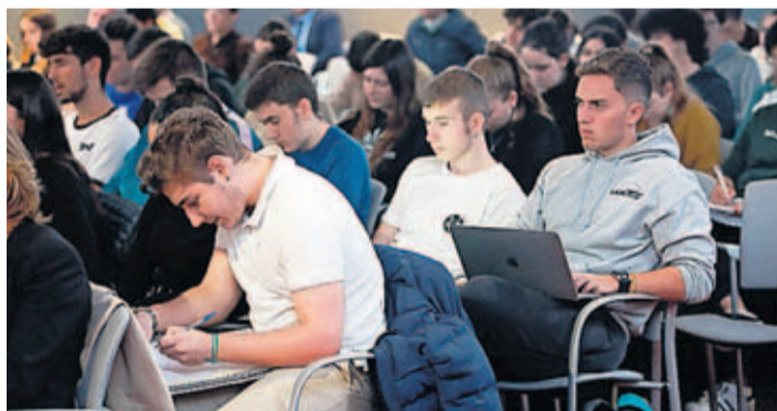
Los estudiantes, durante la jornada de “La Asturias que funciona”.