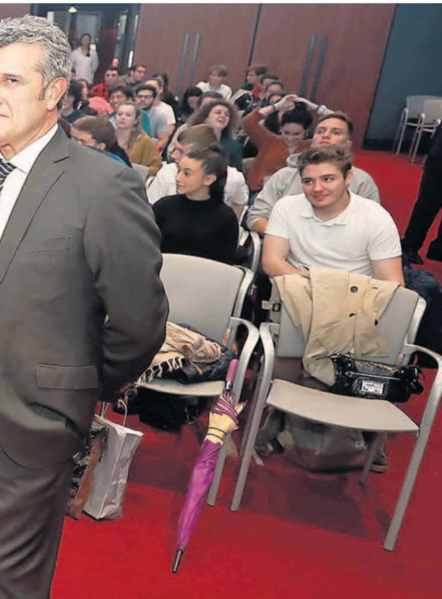
en el salón del Club Prensa Asturiana.

por 94 compañías, en su gran mayoría concentradas en Madrid. “Antes había una docena en Cataluña, pero se han reducido a la mitad con el conflicto secesionista”, explicó González. “Un proyecto empresarial requiere una reflexión muy profunda; el camino es impredecible, aunque luego es el propio proyecto el que te va pidiendo los pasos a dar”, defendió también ante los estudiantes. Y enfatizó la importancia de los valores en el desempeño empresarial, máxime en una actividad tan anclada a la confianza de los clientes: “El primer mandamiento es la honestidad, dependemos de ello críticamente”.