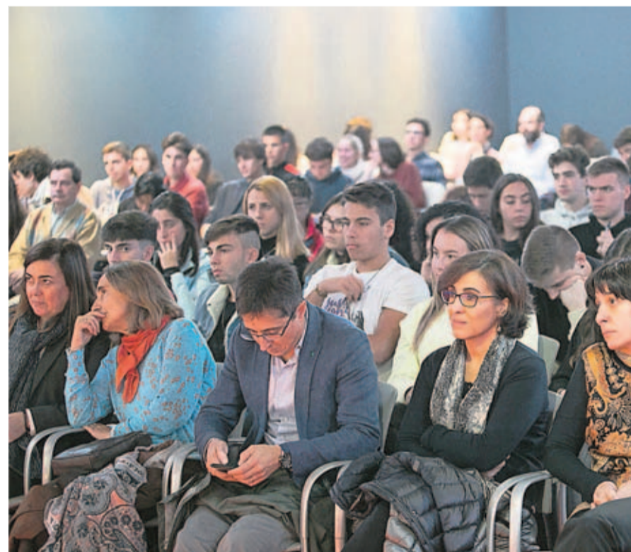
Estudiantes de la Universidad de Oviedo asistentes al coloquio.

sotros” –dijo en alusión a los actuales estudiantes– “sois los consumidores del futuro y el responsable de una empresa con 60 años de edad no puede desarrollar productos para vosotros porque no sabe lo que vais a consumir”. Y al tiempo les expuso el desafío que viene: “Con la inteligencia artificial mutarán más de 800 millones de empleos. Tenéis que ser dinámicos. La Universidad no puede formaros para ocupaciones que aún no se conocen”. Entre el reto y la oportunidad, llamó a levantar la moral y a crear-